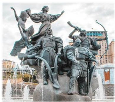
Пам'ятник засновникам Києва

Історія заснування Києва спирається на легендарну оповідь, викладену в «Повісті минулих літ» – давньоруській літописній пам'ятці XII століття. Згідно з легендою, Київ закладено у V столітті братами Києм, Щеком і Хоривом та їхньою сестрою Либідь, а від імені найстаршого з них – полянського князя Кия – пішла назва міста. Археологічні знахідки підтверджують безперервний розвиток поселення на Старокиївській горі на правому березі Дніпра від II половини V століття – I половини VI століття. У наступні два сторіччя було заселено сусідні підвищення, і на межі VIII–IX століть Київ став центром