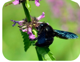
Ксилокопа, або бджола- тесляр