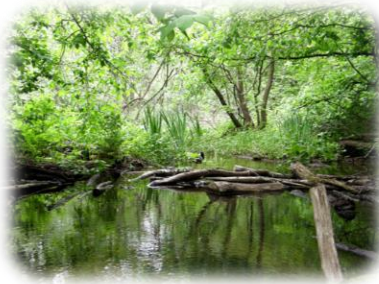
Заказник «Лісники». Один з рукавів р. Віта

Невелике урочище «Бичок» – єдина в межах парку ділянка, де збереглась заплавна діброва з різнобарвним травостоєм. В деревостані в основному домінує дуб звичайний. Зустрічаються екземпляри віком кілька сотень років. Характерними є заплавні пониження з переважанням в'язів і чорної та білої тополь 1 .