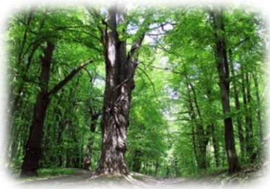
Дуби – Голосіївські велетні

НПП «Голосіївський» розташований у правобережній частині міста Києва. Парк складається з кількох відокремлених частин різного розміру, які розташовані у Голосіївському, Святошинському та Оболонському районах м. Києва 1 . Листяні, мішані та хвойні (соснові) ліси різного ценотичного складу займають понад 90% загальної площі НПП «Голосіївський».