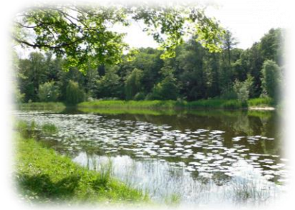
Голосіївський парк ім. М.Т. Рильського

Урочище «Теремки» за природними умовами та видовим складом нагадує Голосіївський ліс, але знаходиться воно на вирівняній частині Київського плато. Тут збереглись