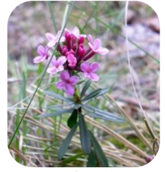
Вовчі ягоди пахучі