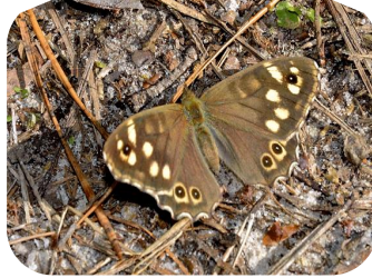
Метелик осадець Егерія