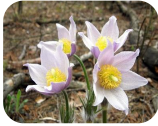
Сон розкритий (широколистий)