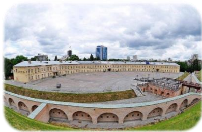
Національний історико- архітектурний музей «Київська фортеця»

У м. Києві створено 4 регіональних ландшафтних парки («Партизанської Слави», «Лиса Гора», «Дніпровські острови», «Смородинський»). Київський зоологічний парк загальнодержавного значення – унікальний «музей живої природи», який щорічно відвідують близько 600 тис. киян та гостей столиці.