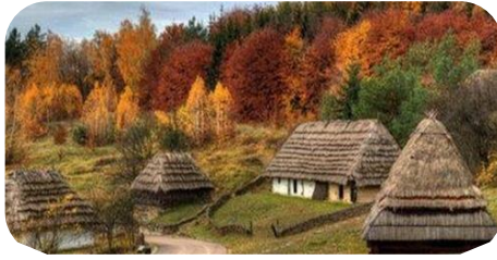
Національний музей народної архітектури та побуту

«Софія Київська»; Національний історико-архітектурний музей «Київська фортеця»; Національний музей народної архітектури та побуту України.