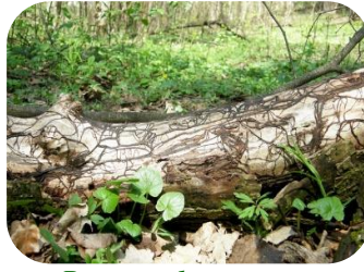
Ризоморфа опенька осіннього