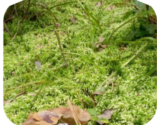
Сфагнові мохи на заболоченому березі озера