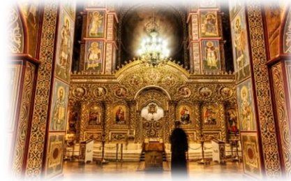
Михайлівський Золотоверхий монастир